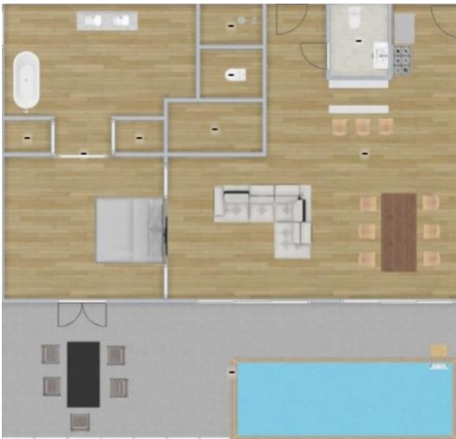
Preferred Club Presidential Suite – Piso 8 vo.

Con cama King: 3 adultos o 2 adultos y 2 niños