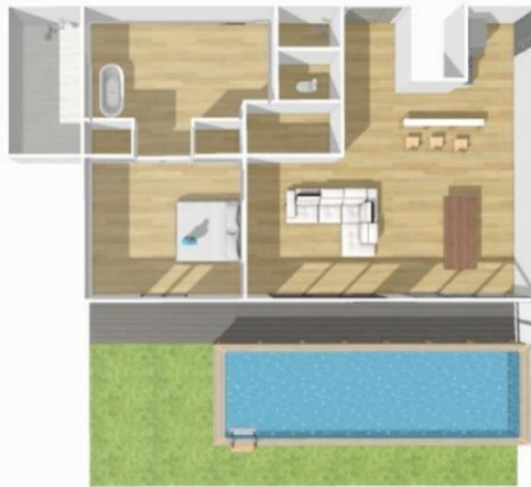
Preferred Club Presidential Suite – Planta Baja