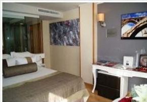
Interior de l'habitació 'Ciutat d'Alcoi'.

L'Hotel Vila Venècia de Benidorm, el primer cinc estrelles obert a la ciutat dels gratacels, ha dedicat una de les seues habitacions a Alcoi.